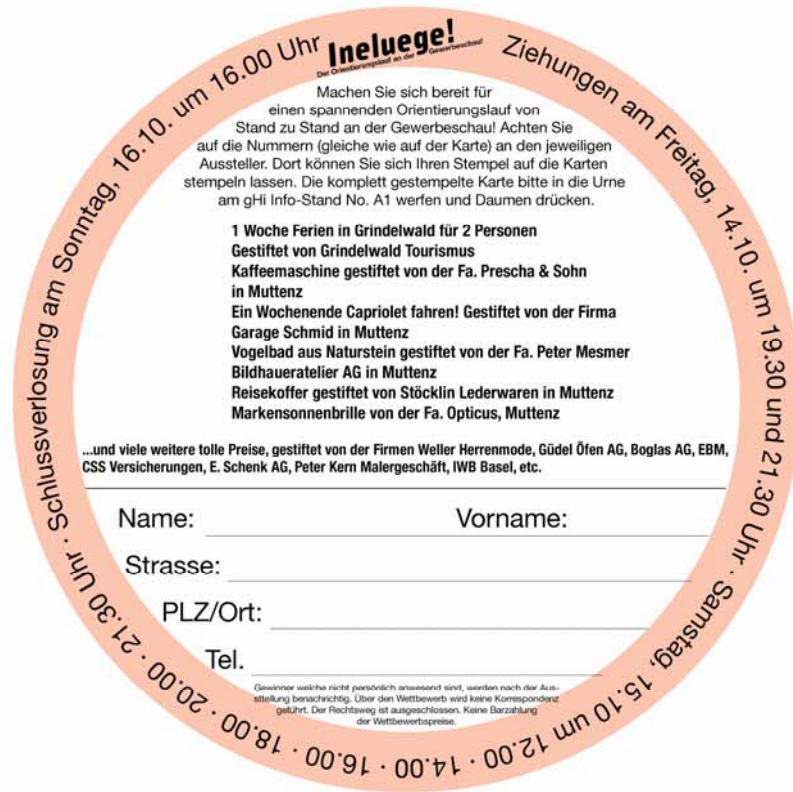
Wettbewerbskarte Vorder- und Rückseite